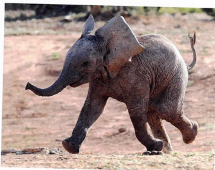
Blij olifantenkalf

dieren en bij de behandeling van gedragsproblemen. Een voorbeeld van een uiting van het panieksysteem, zijn honden met verlatingsangst. Deze honden kunnen absoluut die niet alleen blijven, ook niet voor een korte periode. Zodra ze alleen worden gelaten raken ze in paniek. Sommige dieren gaan vocaliseren en andere dieren gaan dingen slopen of zich ontlasten. De hond wordt pas weer rustig als hij niet meer alleen is. Honden zijn roedeldieren en zijn dus het liefst samen met andere dieren. Dit kunnen honden zijn, maar ook mensen die een roedel vormen voor de hond. Vandaar dat veel honden het ook heel fijn vinden om in je bed te liggen. Dat is jouw 'hol' en ruikt heel erg naar jou. Een hond moet als pup leren dat hij ook alleen kan blijven en dat de rest van de roedel gewoon weer terugkomt. De ene hond kan dit veel makkelijker dan de andere hond. Het is belangrijk dat hier voldoende rust en tijd voor wordt genomen bij het aanleren. Als een hond het goed heeft aangeleerd kan hij gerust een aantal uur alleen